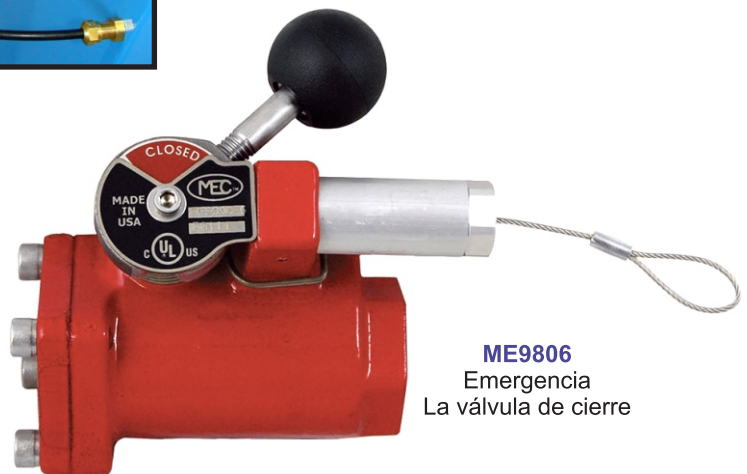
ME9806 Emergencia La válvula de cierre