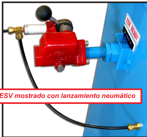
ESV mostrado con lanzamiento neumático