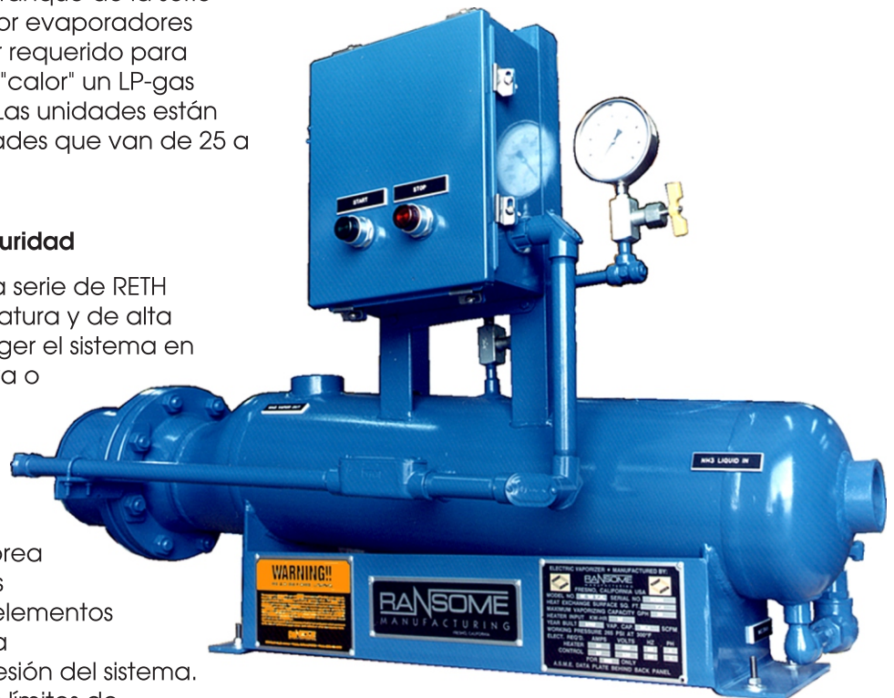
Modelo RETH50 Calentador del Tanque

Los calentadores del tanque de la serie de RETH tienen dispositivos de alta temperatura y de alta presión de protección para proteger el sistema en caso de una temperatura excesiva o sobre-condición de la presión. Un Snapdisk el tipo interruptor de alta temperatura es instalado en la parte potencialmente más caliente de la inmersión del buque. Monitorea la temperatura de los alrededores baño de propano líquido y los el elementos calefactores de inmersión. La alta el presostato monitorea la alta presión del sistema. Si se exceden cualquiera de estos límites de seguridad, el cierre de seguridad ocurre. Reinicio manual de la sistema se requiere una vez que la fuente de la el problema ha sido resuelto.